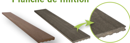
Planche de finition Forexia®

Cet élément de finition permet l'encadrement d'une terrasse et est à fixer avec les vis spéciales composite,